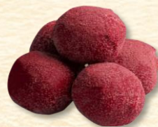
z mascarpone i orzechami włoskimi