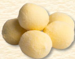
z kremem orzechowo -czekoladowym